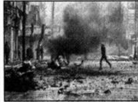
Perang di Syria