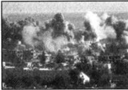
Perang di Iraq

Gambar menunjukkan suasana peperangan yang berlaku di Timur Tengah.